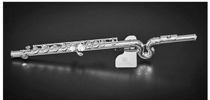
Das Instrument steht ab sofort für Schnupperkurse zur Verfügung!