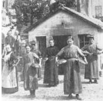
Backhaus in Neckarwestheim vor vielen Jahren

Wir treffen uns um 14:00 Uhr an der Reblandhalle. Die Pestozubereitung macht jeder Teilnehmer für sich zu Hause.