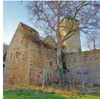
Gotisches Steinhaus mit Bergfried

und des gotischen Steinhauses auch die seit vielen Jahren ungenutzten historischen Gebäude – ehemalige Meierei und Oberes Back- und Waschhaus – mit dem Einbau von 12 modernen und ansprechenden Hotelzimmern einer neuen Nutzung zugeführt. Die Schloss Liebenstein GmbH & Co. KG und die Gemeinde beteiligen sich, wie vertraglich vereinbart, finanziell an der Sanierung des Bergfrieds und am Wiederaufbau des teilweise eingestürzten gotischen Steinhauses.