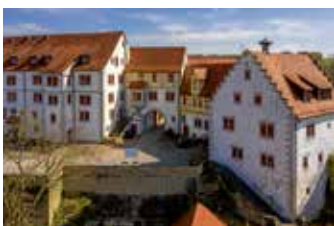
Torbogen mit Meiereigebäude (rechts)

nehmer Wolfgang Scheidtweiler verpflichtet, die sanierungsbedürftigen Gebäude auf dem Gelände, wie zum Beispiel den Bergfried, zu restaurieren. Daneben sollen die vorhandenen Gastronomie- und Hotelräume renoviert und zusätzlich neue Hotelzimmer in leerstehenden Gebäuden geschaffen werden. Alle Zimmer und Appartements werden künftig einen 4-Sterne-Standard aufweisen. Zusammen mit Jako Baudenkmalpflege (Sanierungspartner der Gemeinde im Jägerhof) wurde ein über rund sechs Jahre angelegter Masterplan erstellt. Nach ausführlichen Abstimmungsgesprächen gaben die Denkmalschutzbehörden im letzten Jahr grünes Licht für den 1. Schritt der Sanierung, der u. a. die Restaurierung des aus dem 13. Jahrhundert stammenden Bergfrieds enthält.