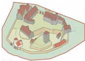
Lageplan der Anlage