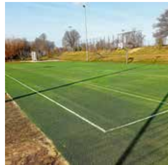
Kleinspielfeld an der Grundschule

Zuschlag erhalten. Der Landkreis Heilbronn hat für die beteiligten Kommunen eine Sammelausschreibung durchgeführt, die jetzt ein Anbieter für sich entscheiden konnte. Mit diesem Anbieter wird jetzt ein konkreter Ausstattungs-/Abdeckungsvorschlag für Neckarwestheim erarbeitet. Anhand dieses Vorschlages wird sich zeigen, ob der vorhandene Standort ertüchtigt werden kann oder ob eventuell ein weiterer Standort hinzukommt.