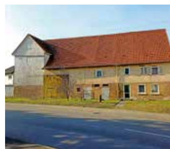
Gebäude Hauptstraße 62

In den vergangenen Sommerferien konnte unsere Grundschule einige Fortschritte in Richtung digitales Lernen machen. Es wurden neben den Tafeln neue große Bildschirme installiert. Zudem wurden mit Unterstützung von Fördermitteln des Landes Tablets für