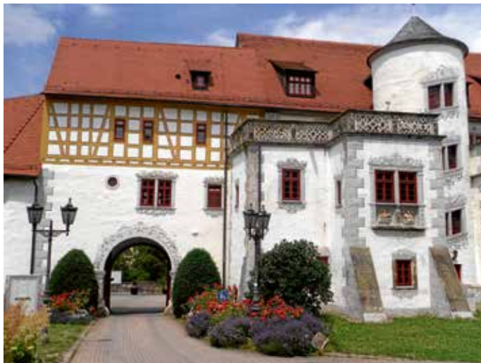
Torbogen von Schloss Liebenstein