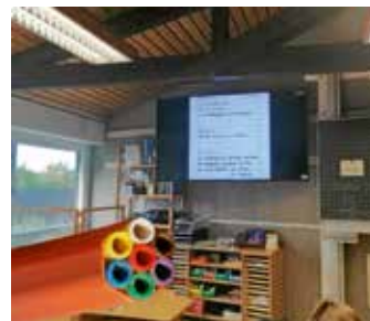
Bildschirm in der Grundschule

Die Investitionen in den Hotel- und Gastronomiebetrieb sind allerdings von der Erbbau-pächterin Private-Schloss-Hotel Collection allein zu tragen. Zudem fließt über die zunächst vereinbarte Laufzeit von 39 Jahren ein jährlicher Erbbau-pachtzins an die KG. Nach Genehmigung des gestellten Bauantrages sollen die Arbeiten zügig begonnen werden. Die weiteren Schritte des Masterplans sehen u. a. die weitere Nutzbarmachung von leerstehenden Gebäuden für den Hotelbetrieb, aber auch die Sanierung der vielfach vorhandenen Mauern auf dem Gelände und die Installation eines Nahwärmenetzes auf der Schlossanlage vor. Zudem sollen weitere Bereiche der Anlage gastronomisch genutzt werden.