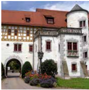
Torbogen von Schloss Liebenstein

Die nächste öffentliche Führung auf Schloss Liebenstein findet am 2. Oktober, 14:00 Uhr mit Doris Fezer statt.