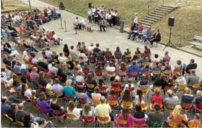
Begrüßungsfeier für Klasse 5 am Hölderlin-Gymnasium Lauffen 2022/23

Auch das Högy hat am 12. September wieder seine Pforten geöffnet und der Beginn des neuen Schuljahres ist vielversprechend: Die SMV hat nach zwei Jahren pandemiebedingter Pause erstmals wieder eine Unterstufenparty veranstaltet, demnächst werden die neuen Klassensprecherinnen bzw. Klassensprecher gewählt und die zahlreichen Arbeitsgemeinschaften haben hochmotiviert ihre Arbeit aufgenommen.