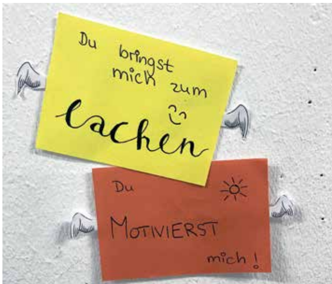
Botschaften der Schutzengel am Högy