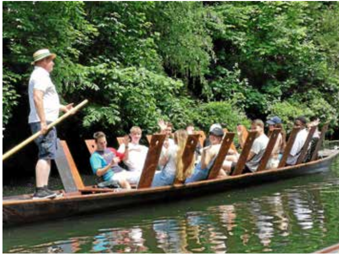
Abiturienten-Abschlussfahrt nach Tübingen 2022