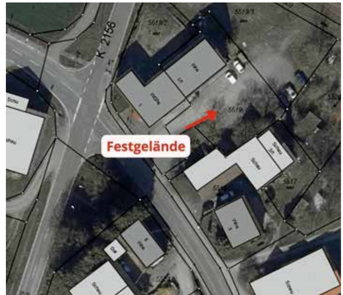
Lageplan Pension Pfahlhof

In diesem Jahr gibt es im Pfahlhof einen Grund zu feiern – unser Ortsteil besteht nun seit 300 Jahren. Dies wollen wir im Rahmen einer Hocketse am 17.07.2022 im Hof der Pension Pfahlhof gebührend feiern. Die Gemeinde und die Neckarwestheimer Vereine und Organisationen haben ein abwechslungsreiches Programm zusammengestellt und sorgen für das leibliche Wohl.