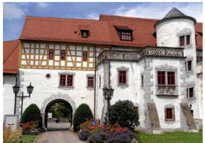
Torbogen von Schloss Liebenstein